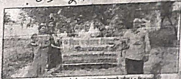
बीएनएमयू में पर्यावरण संरक्षण को लेकर जानकारी देते हैं।

पूरे ब्रह्मांड में केवल पृथ्वी पर पार जाते हैं। पृथ्वी को स्वस्थ, समर्थ और सशक्त बनाना है। प्राकृतिक तत्वों को सम्भालना है वह पर्यावरण कहलाता है। यह हमें बढ़ने तथा विकसित होने का बेहतर माध्यम देता है, यह हमें यह सब कुछ प्रदान करता है जो इस ग्रह पर जीवन को बनाए रखने हेतु आवश्यक है।